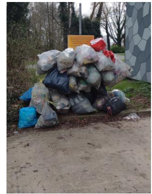
De borden met 6 hele haken voor 59 woningen.

Waar we bijna dagelijks tegen aankijken op straat en op de galerij.