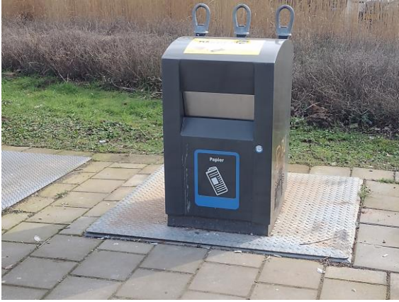
1 papierbak voor 6 flats Geplaatst bij flat 3.